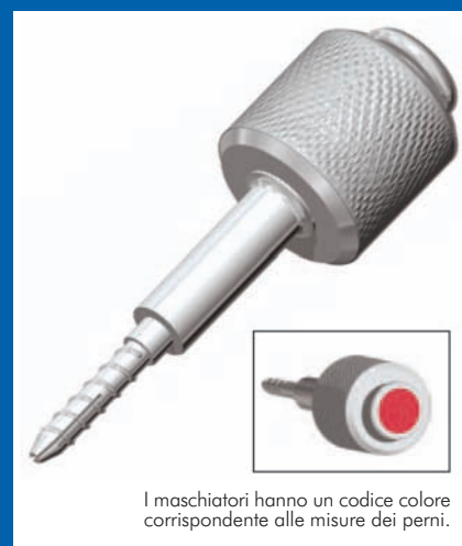
I maschiatori hanno un codice colore corrispondente alle misure dei perni.

Metodo predicibile di posizionamento del perno per ogni situazione clinica (Flexi-Flange Fiber è raccomandato quando si deve scegliere un perno in fibra in casi clinici con dentina coronale ridotta o assente).