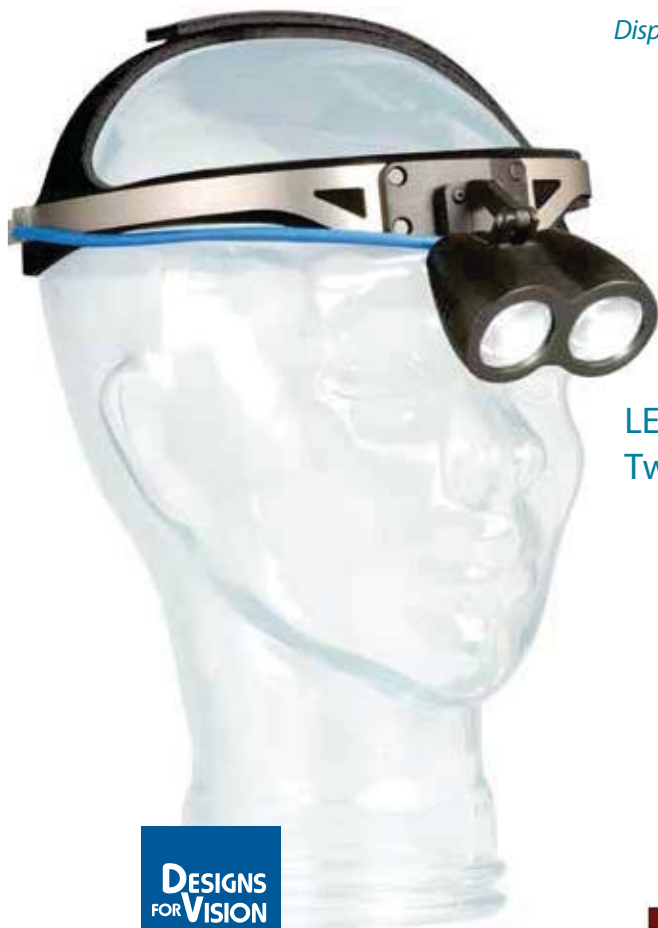
LED DayLite Twin Beam

Disponibile con attacco clip-on o con caschetto