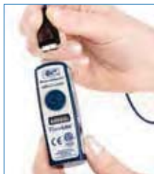
Connessione micro USB: cavo a rilascio rapido