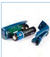
Batteria da 3400 mAh con accesso facilitato per la sostituzione