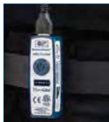
Pulsante one touch e disco regolatore di intensità