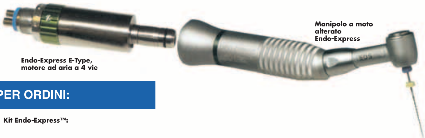
Endo-Express E-Type, motore ad aria a 4 vie